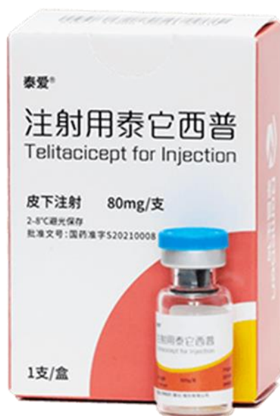
图一：注射用泰它西普

批程序，并作为具有突出临床价值的临床急需药品于 2021 年 3 月在中国获附条件批准上市。