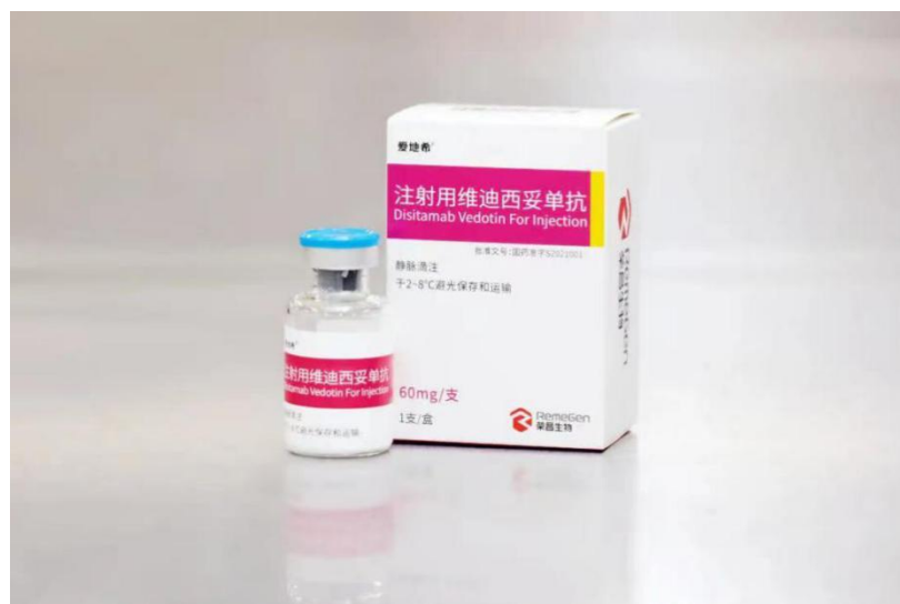
图二：注射用维迪西妥单抗

维迪西妥单抗是公司研发的中国首个原创抗体偶联（ADC）药物，以肿瘤表面的 HER2 蛋白为靶点，能精准识别和杀伤肿瘤细胞，在治疗胃癌、尿路上皮癌、乳腺癌等肿瘤的临床试验中均取得了全球领先的临床数据，是我国首个获得美国 FDA、中国药监局突破性疗法双重认定的 ADC 药物，其用于治疗胃癌、尿路上皮癌的新药上市申请经优先审评审批程序，并作为具有突出临床价值的临床急需药品分别于 2021 年 6 月、2021 年 12 月在中国获附条件批准上市。