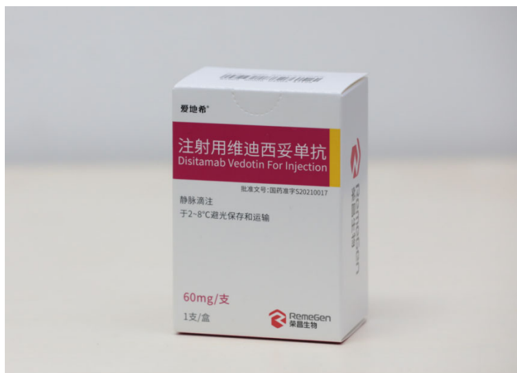
图二：注射用维迪西妥单抗