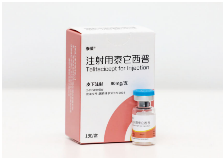
图一：注射用泰它西普

欧洲等国家和地区的授权，得到了国家“十一五”、“十二五”、“十三五”期间“重大新药创制”科技重大专项支持，其用于治疗系统性红斑狼疮的新药上市申请经优先审评审批程序，于 2023 年 11 月在中国由附条件批准转为完全批准。